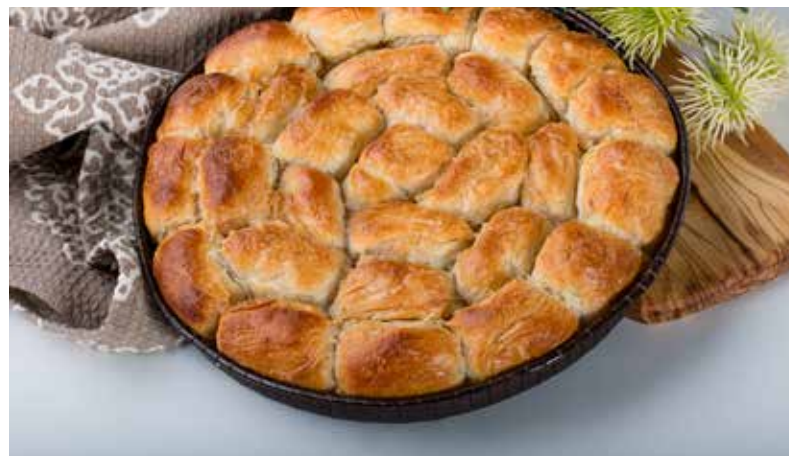
MANTIJE SA SIROM U TEPSIJI