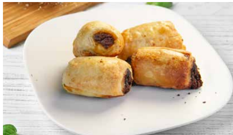
MANTIJE SA NUTELOM