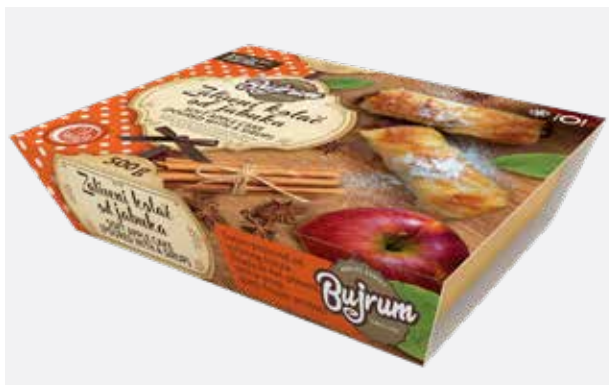
ZALIVENI KOLAČ OD JABUKE