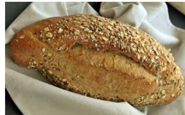
RAŽEV VERONA HLJEB