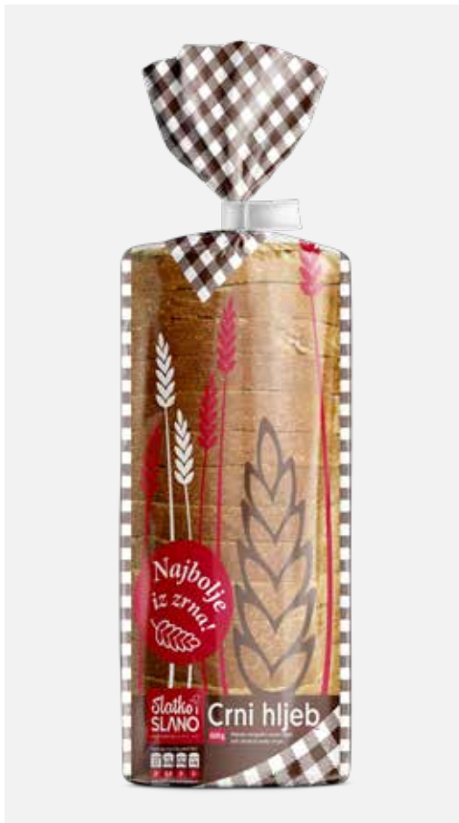
CRNI REZANI HLJEB