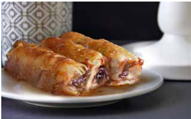
ZALIVENI KOLAČ OD JABUKE