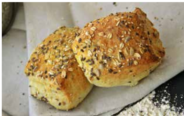
KRALJEVSKO KUKURUZNO PECIVO