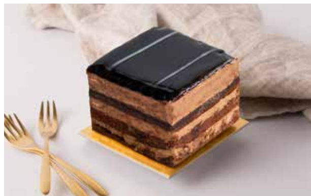
BELGIJSKI ČOKO BIJELI