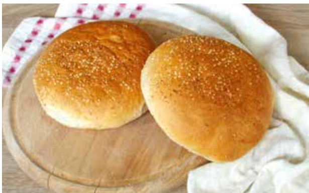
HAMBURGER BV PECIVO