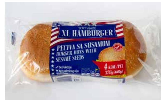
XL HAMBURGER PECIVO