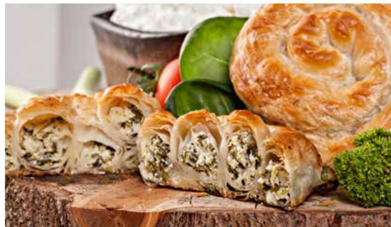
*PITA U ZVRKU