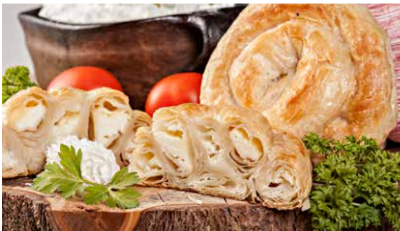
*PITA U ZVRKU