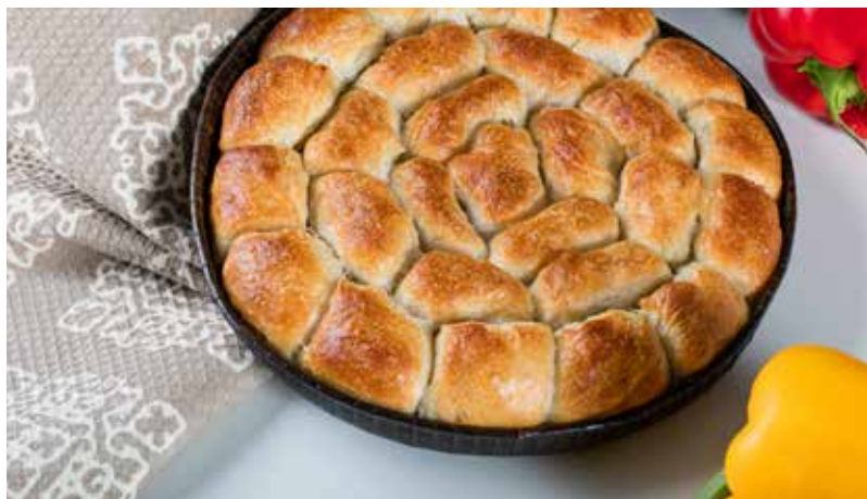
MANTIJE SA ŠPINATOM U TEPSIJI