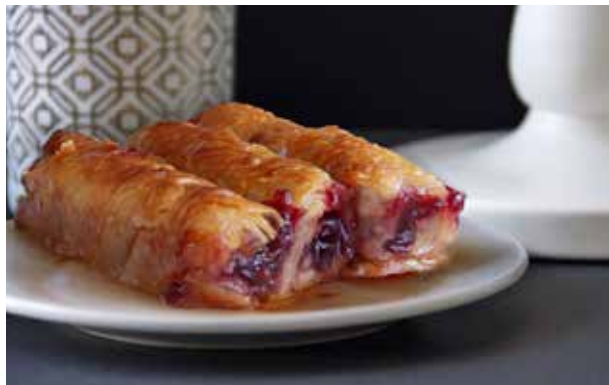
ZALIVENI KOLAČ OD VIŠNJE