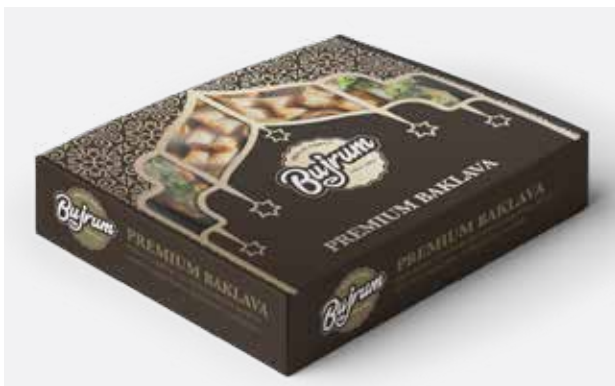
BAKLAVA PREMIUM MIX