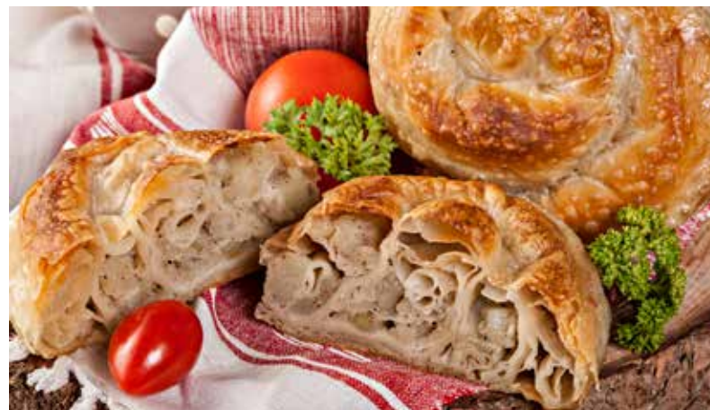
*PITA U ZVRKU