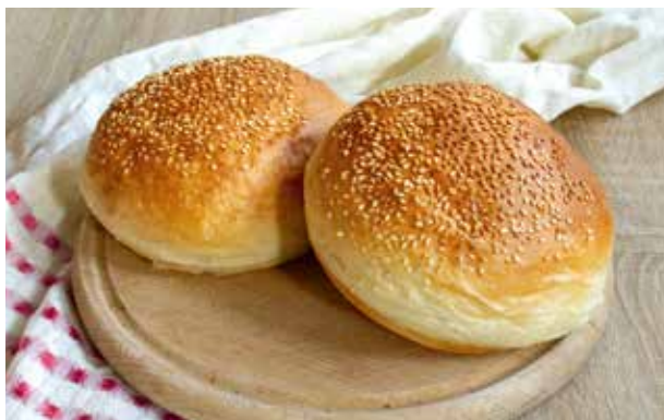
HAMBURGER MCD PECIVO