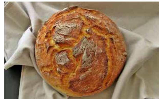
KUKURUZNI BAVARSKI HLJEB