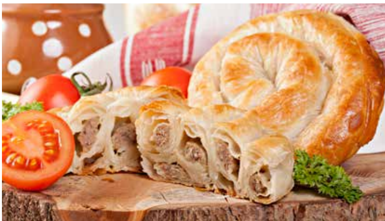
*PITA U ZVRKU