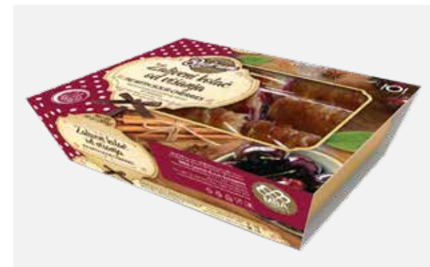
ZALIVENI KOLAČ OD VIŠNJE