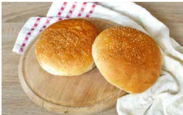
HAMBURGER PECIVO BV