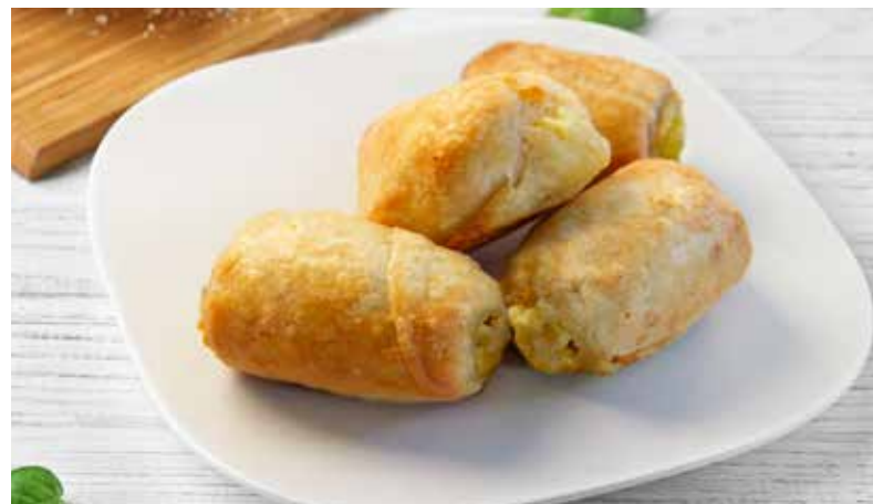
MANTIJE SA SIROM