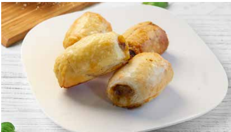
MANTIJE SA MESOM