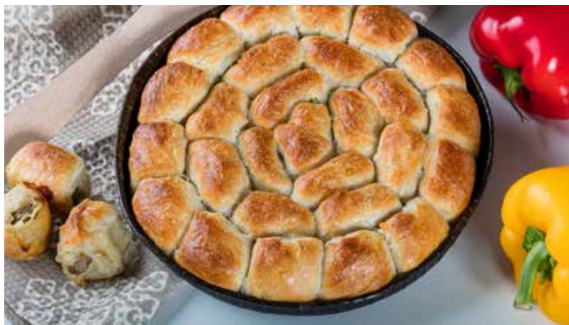
MANTIJE SA MESOM U TEPSIJI