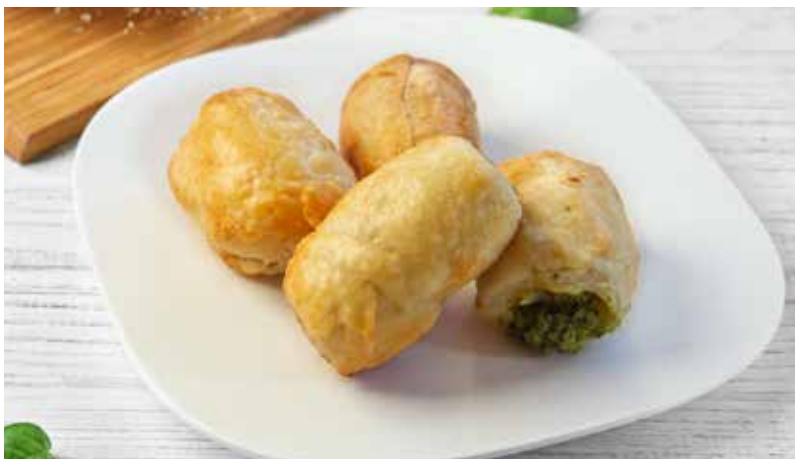
MANTIJE SA ŠPINATOM