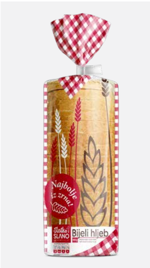
BIJELI REZANI HLJEB